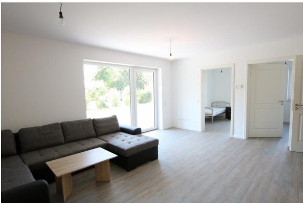
Wohn- Essbereich mit Terrassenzugang