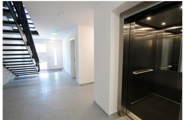
Eingang / Fahrstuhl