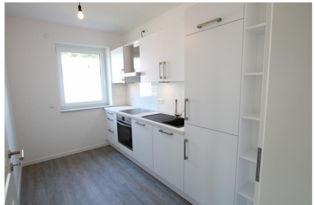
hochwertige EBK mit Geschirrspüle